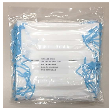
梱包 (クリーンパック)